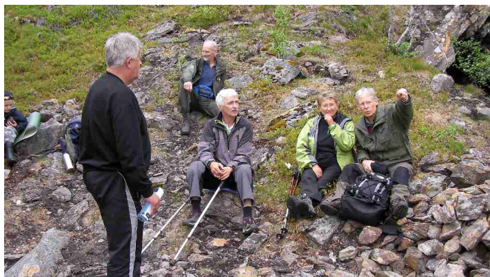
Bilde fra tur til skjerpene i Skårnesdalen